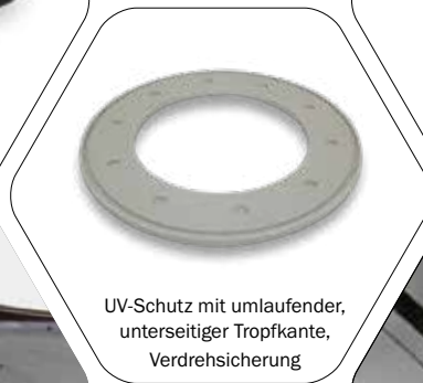
UV-Schutz mit umlaufender, unterseitiger Tropfkante, Verdrehsicherung