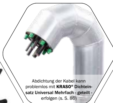
Abdichtung der Kabel kann problemlos mit KRASO® Dichteinsatz Universal Mehrfach - geteilt erfolgen (s. S. 86)