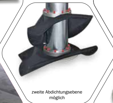
zweite Abdichtungsebene möglich