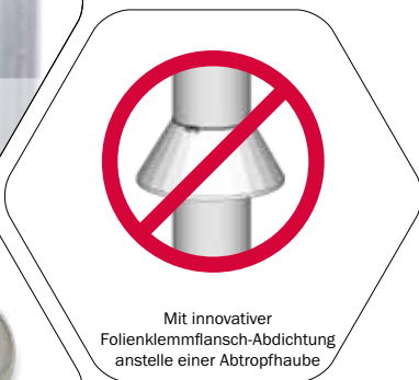
Mit innovativer Folienklemmflansch-Abdichtung anstelle einer Abtropfhaube