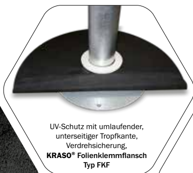
UV-Schutz mit umlaufender, unterseitiger Tropfkante, Verdrehsicherung, KRASO® Folienklemmflansch Typ FKF